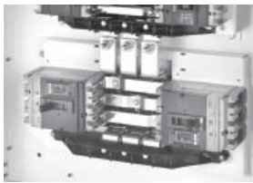
NBD branch breaker extension 2 Ways